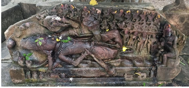
चित्र स० 3 शेषशायी (अनन्तशायी) विष्णु प्रतिमा, सोमनाथ मंदिर, चर ग्राम, चित्रकूट, उ०प्र०